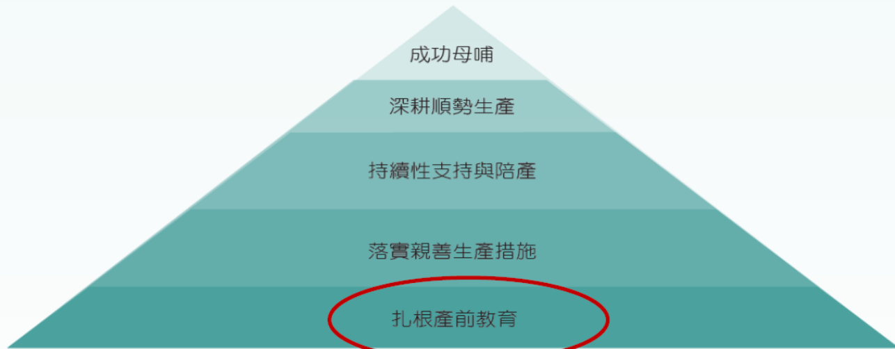
圖一、成功母哺金字塔