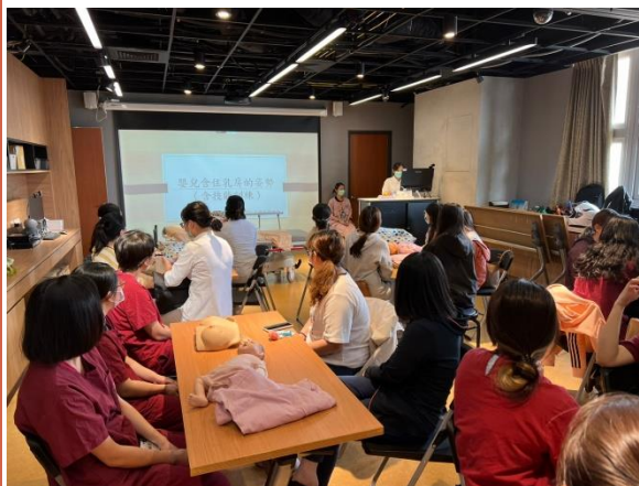
嬰兒含住乳房的姿勢